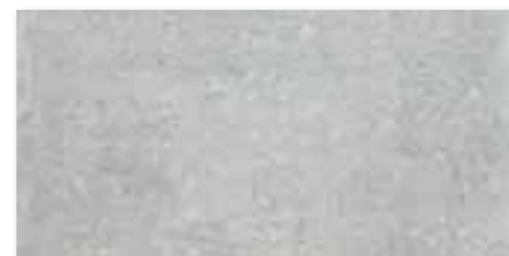
DAKSE661 PEI 5 \odot 78 / m 2 mat | matt