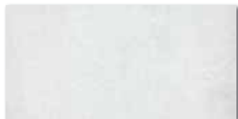
DAKSE660 PEI 5 \odot 78 / m 2 mat | matt