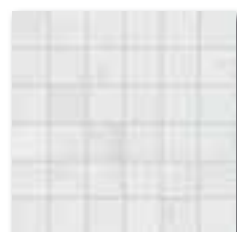
DDM06660 (SET) PEI 5 ● 72 / set mat | matt