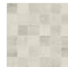
DDM06662 (SET) PEI 5 ● 72 / set mat | matt