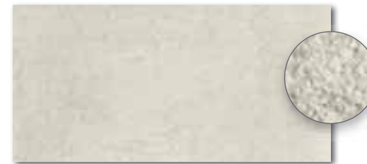
DARSE662 PEI 5 \odot 82 / m 2 mat | matt šedo-běžová / grey-beige / szara-beżowa / серый-бежевый / szürke-bézs