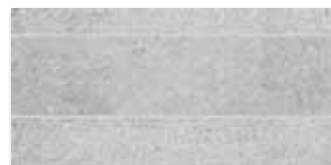
DDPSE661 (SET) PEI 5 ● 68 / set mat | matt