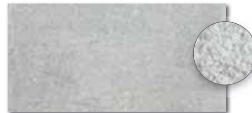
DARSE661 PEI 5 \odot 82 / m 2 mat | matt šedá / grey / szara / серый / szürke