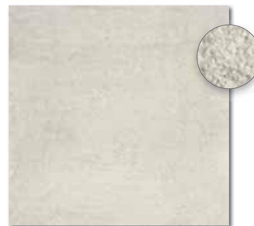
DAR63662 PEI 5 \odot 86 / m 2 mat | matt