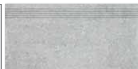
DCPSE661 PEI 5 ● 72 / ks mat | matt