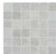
DDM06661 (SET) PEI 5 ● 72 / set mat | matt