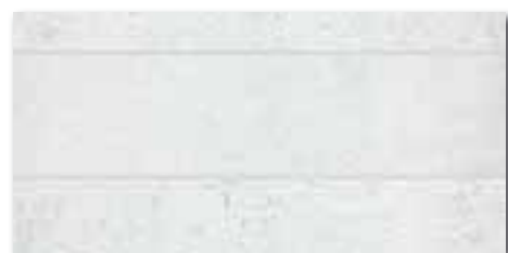
DDPSE660 (SET) PEI 5 ● 68 / set mat | matt