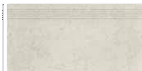
DCPSE662 PEI 5 ● 72 / ks mat | matt