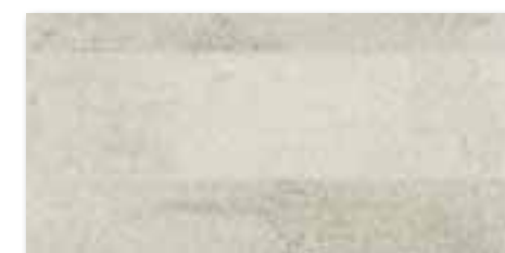
DDPSE662 (SET) PEI 5 ● 68 / set mat | matt