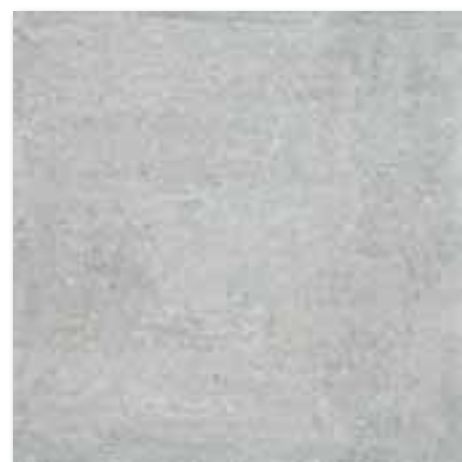
DAK63661 PEI 5 \odot 82 / m 2 mat | matt