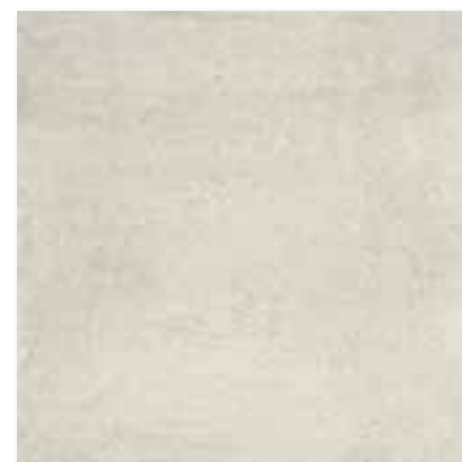
DAK63662 PEI 5 \odot 82 / m 2 mat | matt