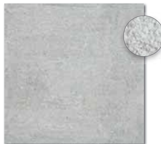
DAR63661 PEI 5 \odot 86 / m 2 mat | matt