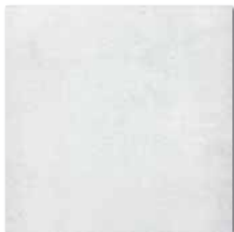
DAK63660 PEI 5 \odot 82 / m 2 mat | matt