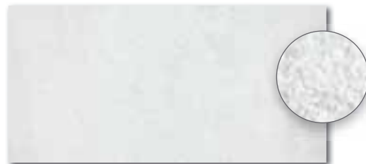
DARSE660 PEI 5 \odot 82 / m 2 mat | matt světle šedá / light grey / jasnoszara / светло-серый / világosszürke