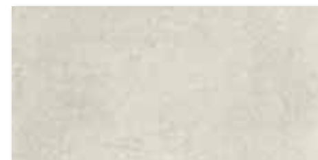
DAKSE662 PEI 5 \odot 78 / m 2 mat | matt