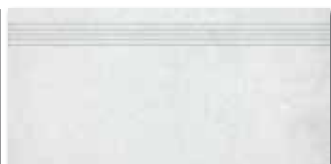
DCPSE660 PEI 5 ● 72 / ks mat | matt